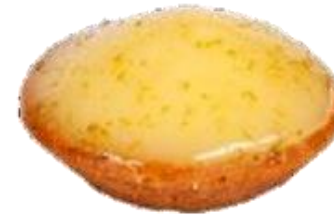
Лимонная тарталетка Лимонный крем на тонкой тарталетке из песочного теста с конфитюром из свежего лимона.