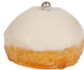
Профитроль Цветок апельсина

Мини-профитроль с кремом флер-д'оранж, покрытый сахарной глазурью.